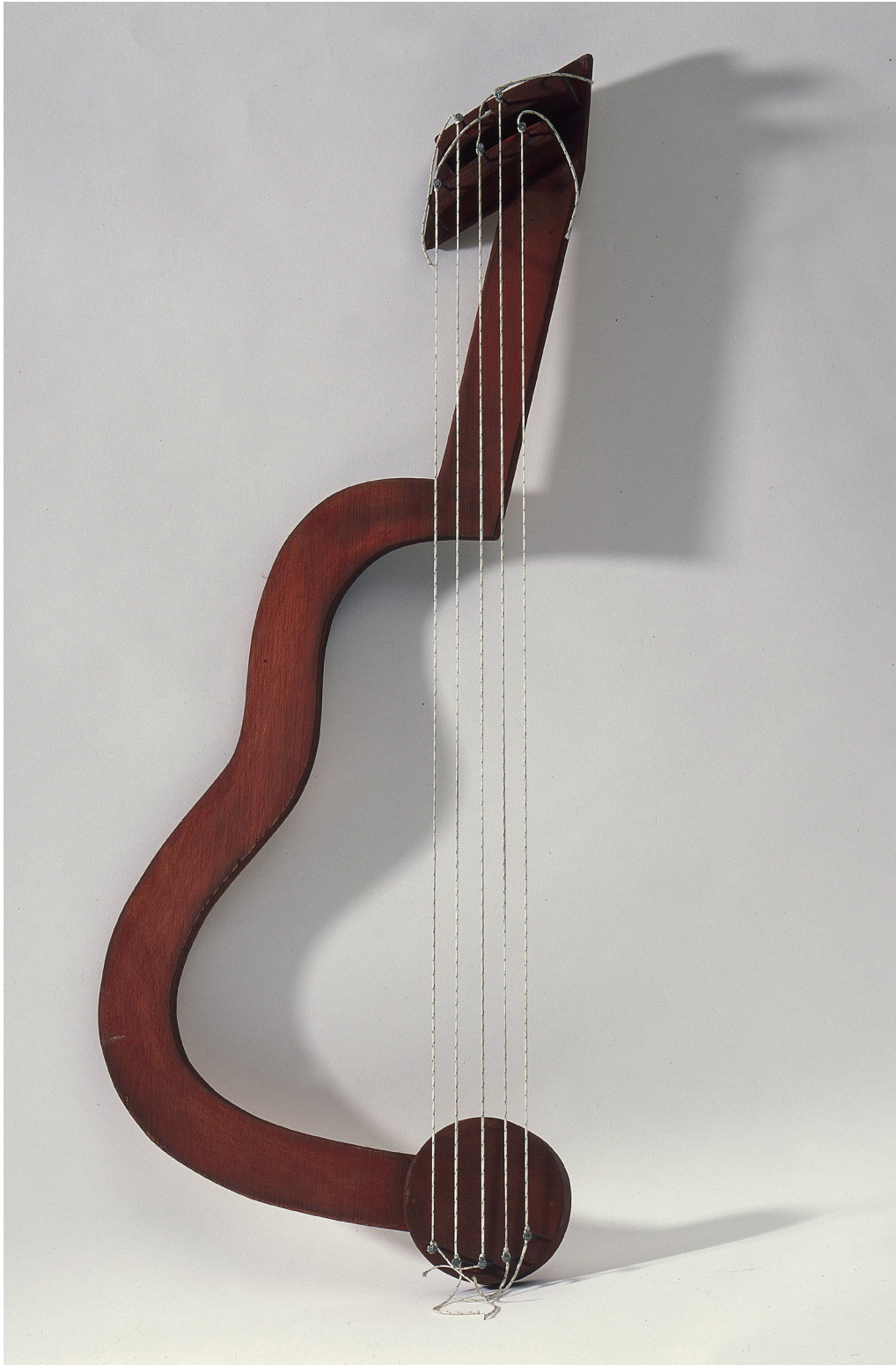
1998, Guitarra Lorquiiana IX, Josep Guinovart