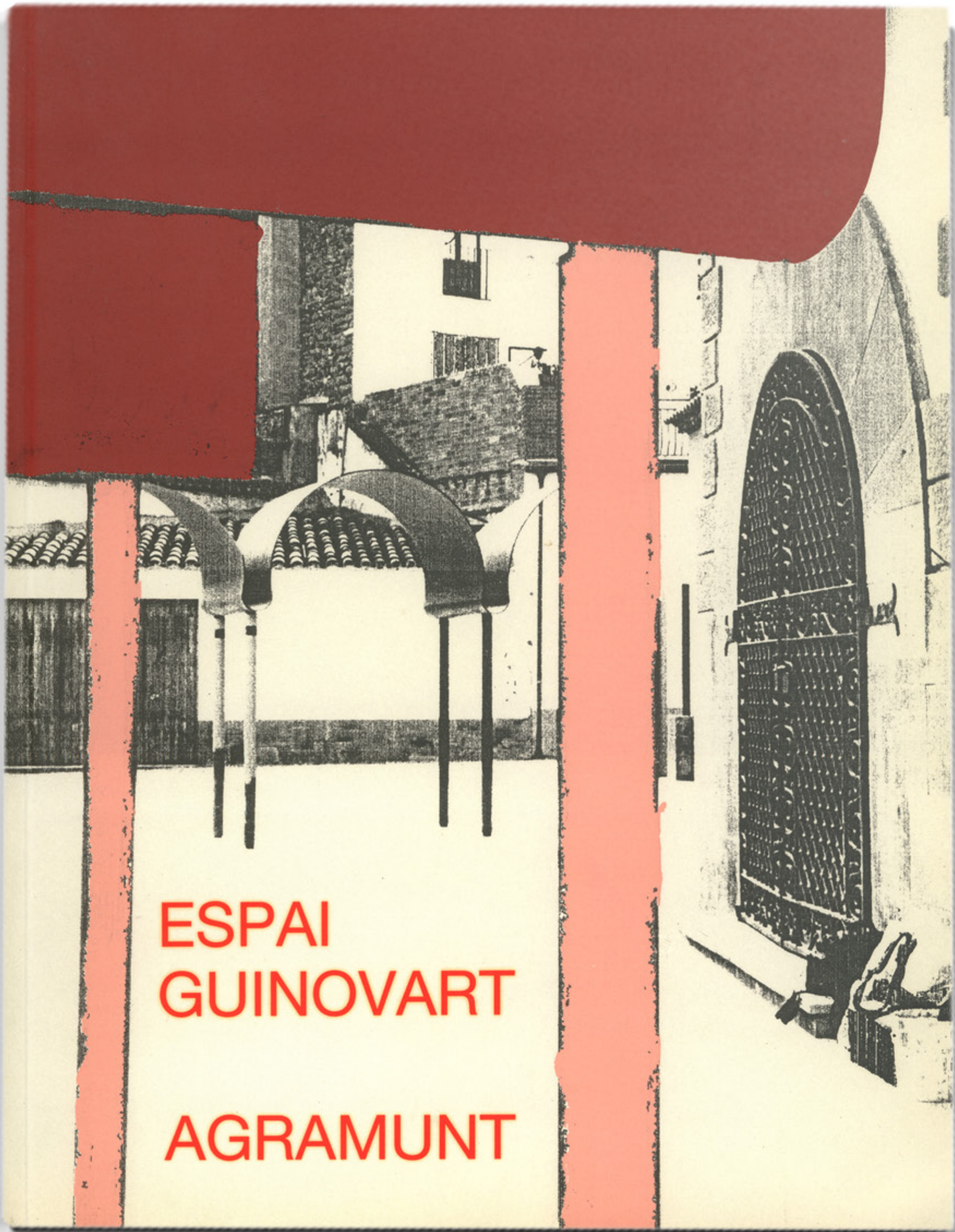
Portada primer catalog de l'Espai Guinovart, 1994

ACTIVITAT REALITZADA AMB LA COL·LABORACIÓ DE