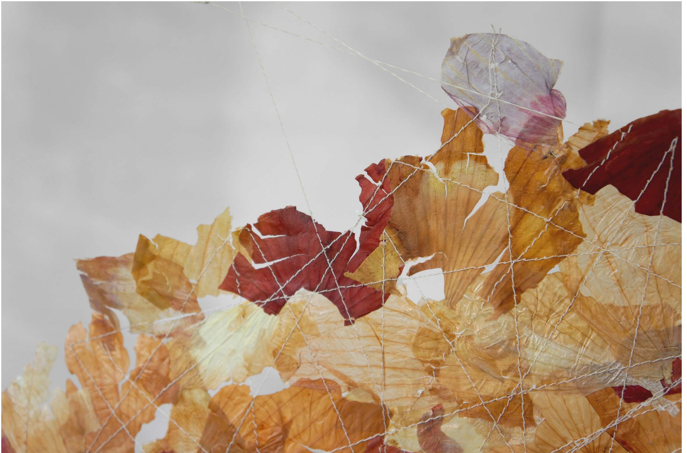
Peu foto: 2020, Fragment de la sèrie La Ceba, Josep Safont

ACTIVITAT REALITZADA AMB LA COL-LABORACIÓ DE