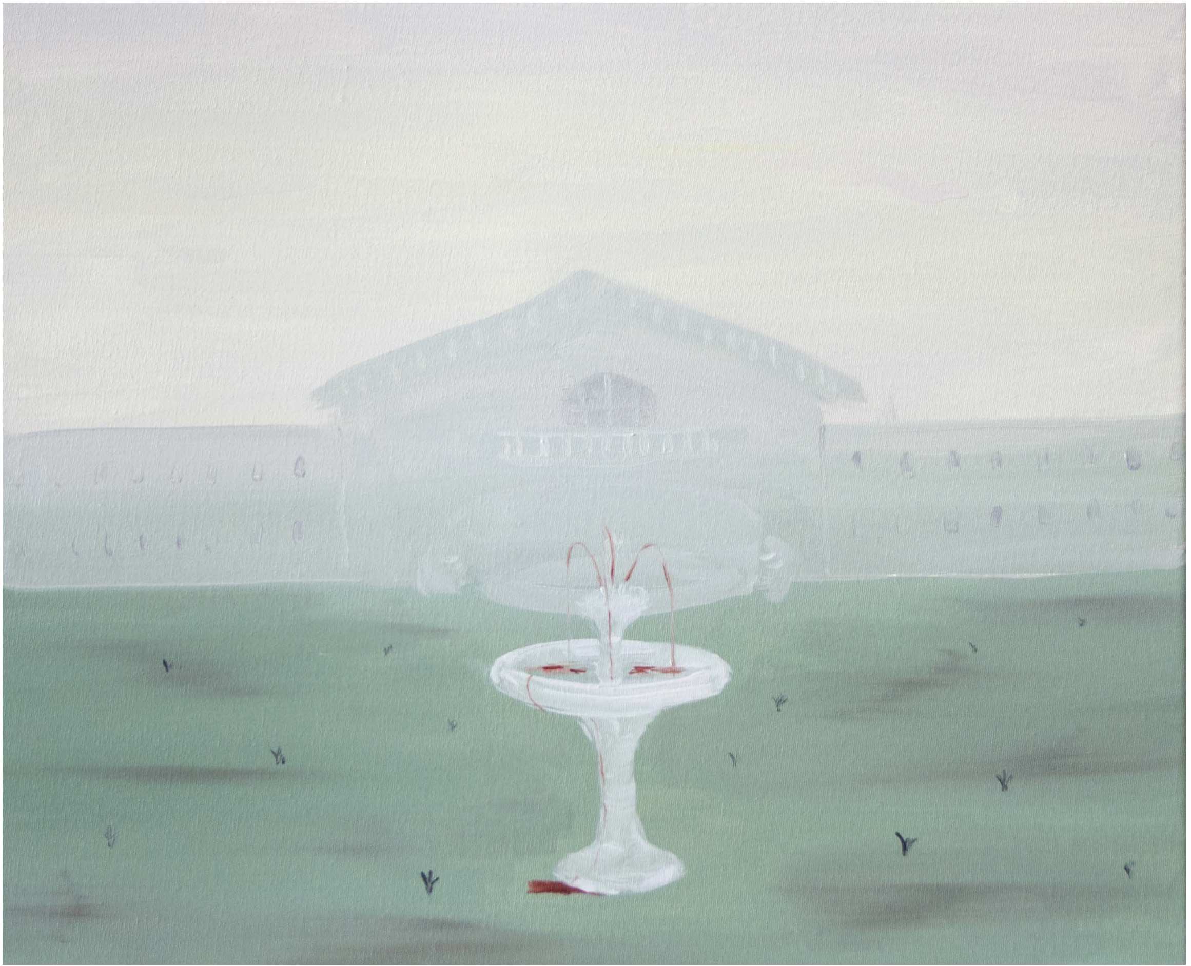
Sense titol, 2014. Oli sobre tela 46x55 cm. Jose Bonell. Josep Guinovart © VEGAP 2022

ACTIVITAT REALITZADA AMB LA COL-LABORACIÓ DE