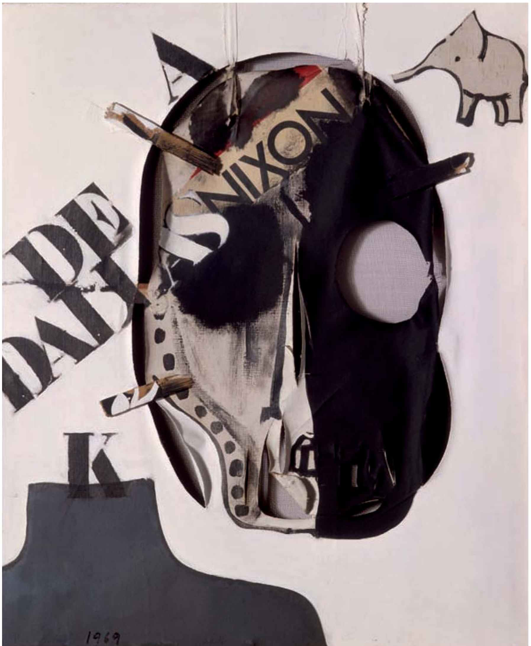
© Josep Guinovart, VEGAP, Lleida 2012. Imatge: De Dallas a Nixon, 1969.

ACTIVITAT REALITZADA AMB LA COL-LABORACIÓ DE