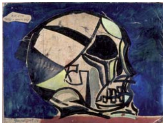
Crani, 1954 Oli sobre tela, 25 x 35 cm