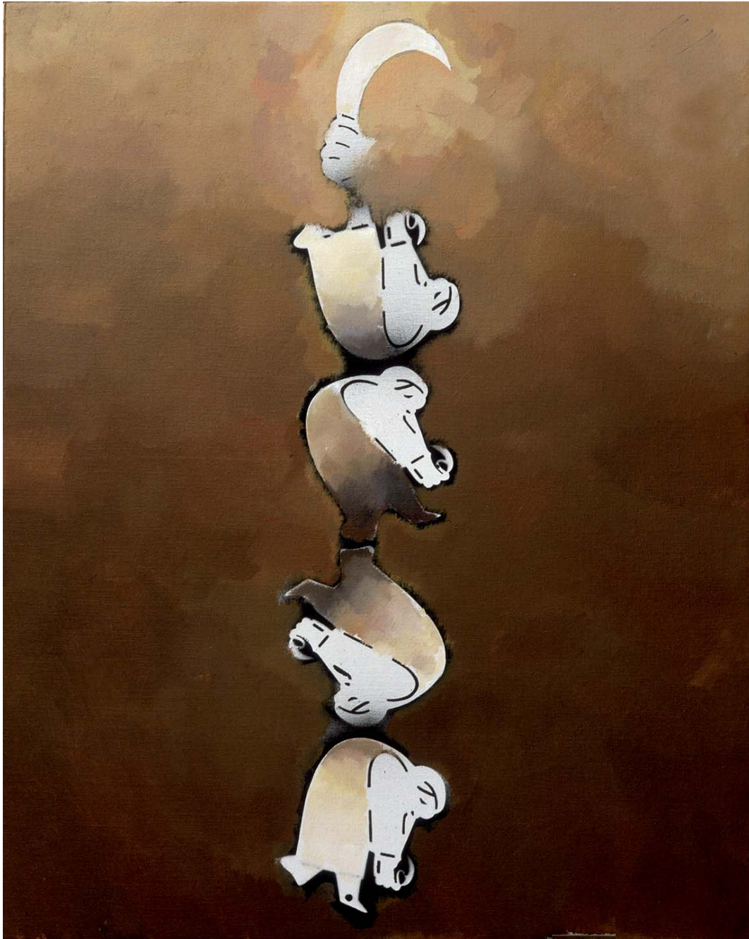
La falç, llum i memòria, 2003

© Josep Guinovart, VEGAP, Lleida, 2010. Disseny i impressió: Aigües Galiques de la Diputació de Lleida. Dipòsit Legal: L. 1213/2010.