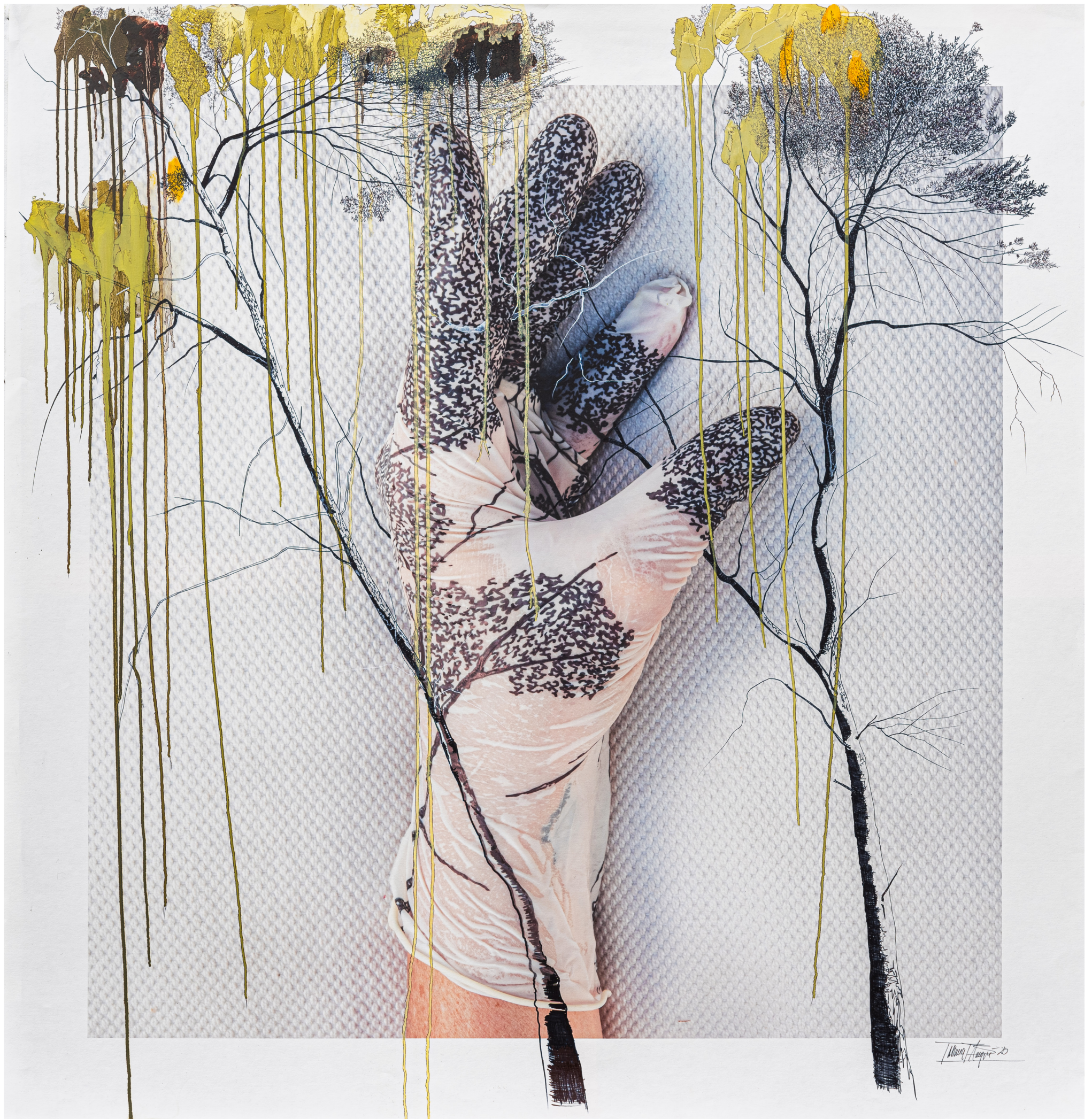
Peu foto: 2021, Reforestació i més enllà 7, Tatiana Blanqué. Dibuix sobre imatge digitalitzada damunt paper Ahlstron. (Wallpaper, Esasy live spray and up), Fotògraf Ernest Brugué.

ACTIVITAT REALITZADA AMB LA COL-LABORACIÓ DE