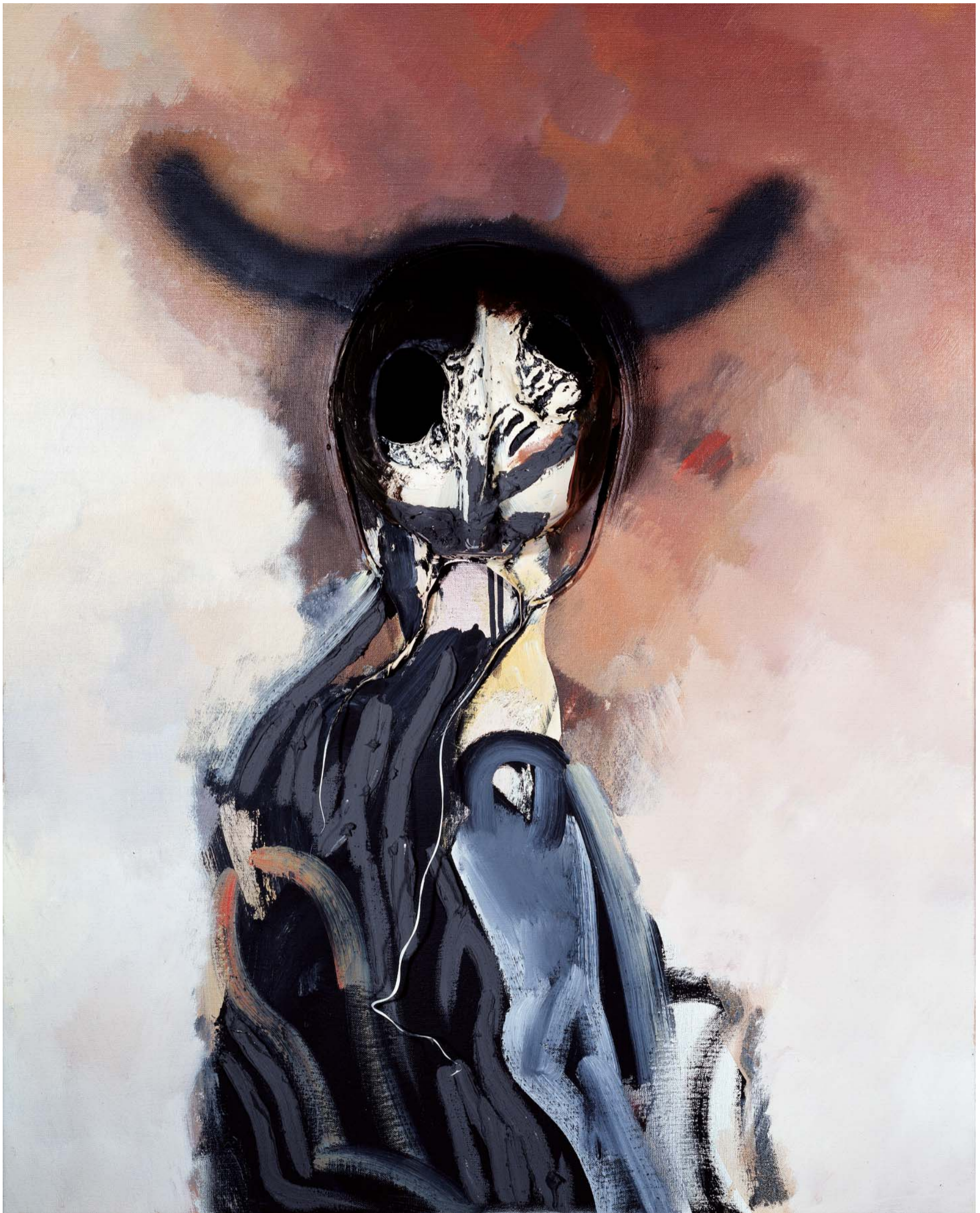
Imatge: Josep Guinovart, Minotaure, 2003. ©Josep Guinovart, VEGAP, Lleida 2017

ACTIVITAT REALITZADA AMB LA COL·LABORACIÓ DE